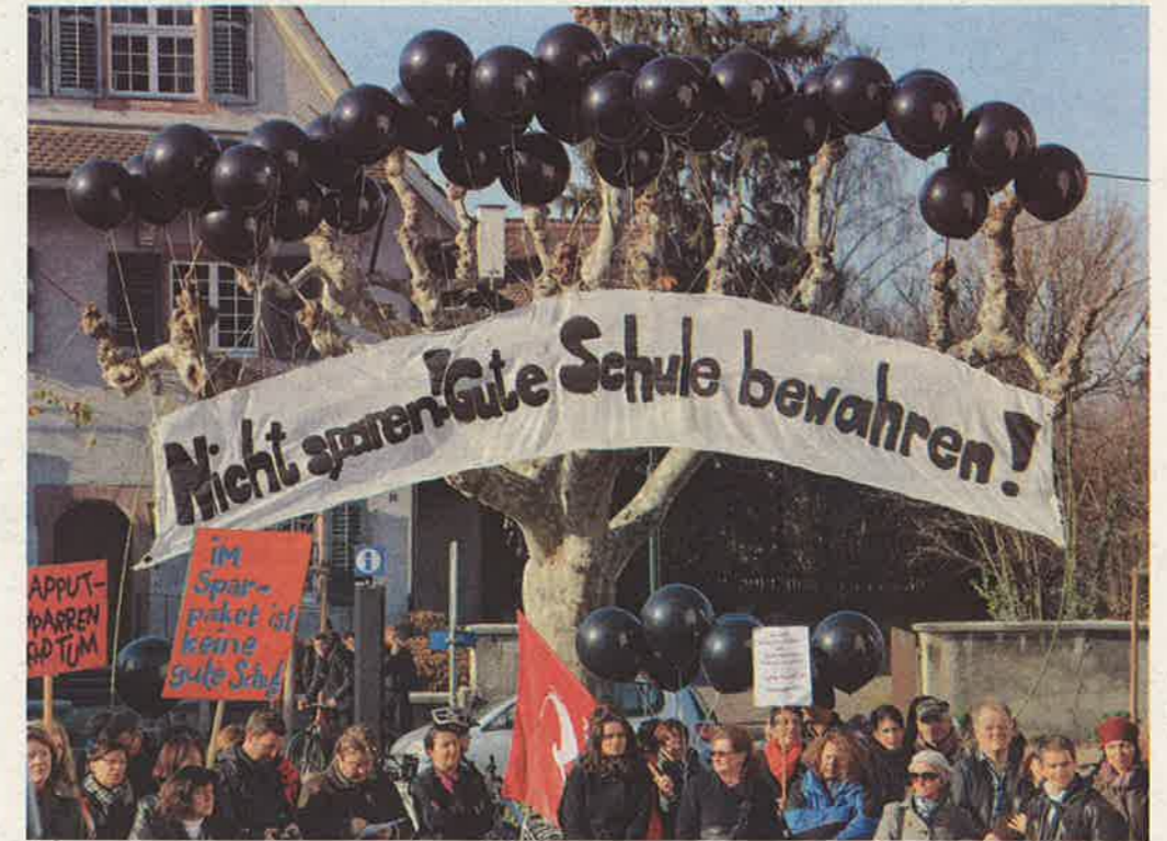
Die GegnerInnen der kurzfristigen Sparmassnahmen sind gut aufgestellt.