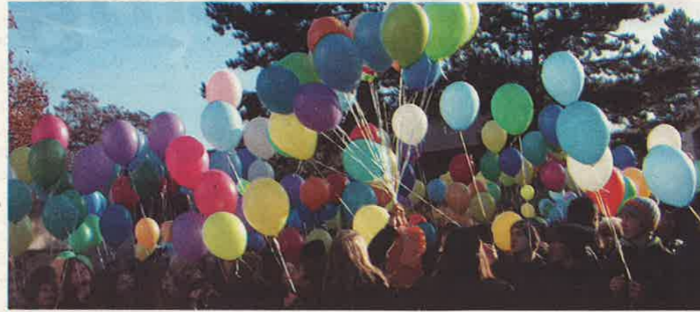
«Luftpost» für Landrat und Regierung: Die Gute Schule BL darf nicht weggespart werden.

Das Entlastungspaket der Basellbieter Regierung löst beeindruckende Protestaktionen aus. Bis zur Behandlung im Landrat und den absehbaren Volksabstimmungen brauchen die GegnerInnen der Sparmassnahmen einen langen Atem.